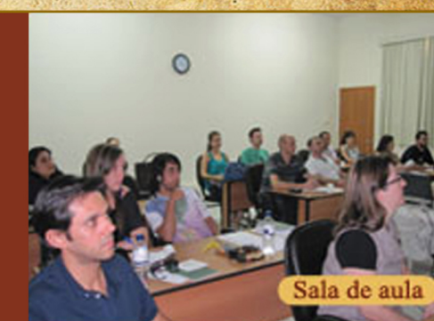
Sala de aula

Os cursos abordam temas de grande relevância no momento. Todas as disciplinas consistem em aulas teóricas com material didático atualizado e aulas práticas em laboratório. Consulte-nos em relação à valores e descontos, bem como sobre transporte e hospedagem.