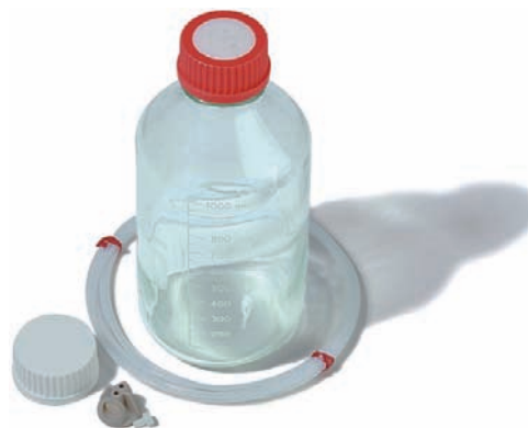
Figura 2. Exemplo de frasco para acondicionamento da fase móvel.

As fases móveis são geralmente acondicionadas em frascos de vidro apropriados (Fig. 2) e colocadas em compartimento adequado, sobre o cromatógrafo. Caso não haja compartimento adequado (geralmente suprido com o cromatógrafo), recomenda-se o emprego de uma bacia retangular que se adapte sobre o equipamento. A colocação de frascos diretamente sobre o equipamento pode levar a acidentes, ocasionando o derramamento de líquido sobre componentes sensíveis do equipamento. Os frascos devem ser tampados para evitar a entrada de material particulado e a contaminação, bem como evitar a evaporação de solventes. Alguns frascos comerciais possuem tampas com filtros de ar, porém essas tampas podem ser facilmente adaptadas no laboratório. Através da tampa deve existir orifício para a entrada do tubo coletor da fase móvel, e em caso de sistema de aspersão de hélio, também para esse. Na entrada do tubo coletor é comum a utilização de um filtro de 10 \mu\text{m} (geralmente de aço inoxidável 316 ou polietileno de altíssima densidade), enquanto na saída do tubo de aspersão de hélio usa-se um “filtro” de 2 \mu\text{m} para a dispersão do gás (Fig. 3).