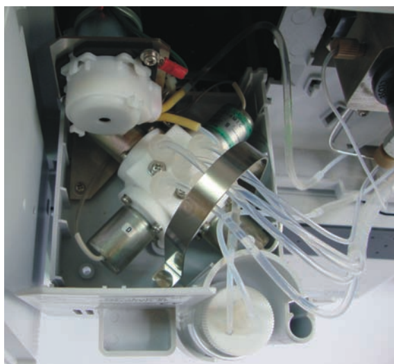
Figura 7. Exemplo de válvula para seleção de solventes em gradiente de baixa pressão.

Após o sistema de pressurização da fase móvel, encontra-se, nos sistemas capazes de elaborar gradientes, um misturador. Esse misturador costuma ter um volume de mistura regulável que deve ser ajustado de acordo com as características de uso do sistema. Um exemplo de ajuste inadequado é a seleção do maior volume de mistura para análises sob gradiente em vazões reduzidas. Atrasos superiores a dez minutos podem ser constatados dependendo da combinação inadequada que for realizada, especialmente em sistemas com gradiente de baixa pressão.