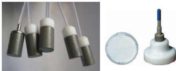
Figura 3. Exemplos de filtros de admissão de fase móvel.