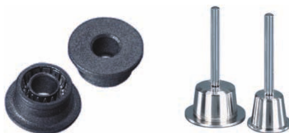
Figura 4. Exemplos de selo de vedação (vista ampliada) e pistões de safira, usados em bombas de HPLC.