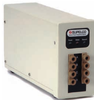
Figura 1. Desgaseificador online a vácuo, o solvente entra no sistema por uma das portas, passa por fina tubulação composta por membrana semipermeável aos gases e sai do sistema em direção à bomba ou válvula seletora do gradiente de baixa pressão.

As fases móveis são geralmente acondicionadas em frascos de vidro apropriados (Fig. 2) e colocadas em compartimento adequado, sobre o cromatógrafo. Caso não haja compartimento adequado (geralmente suprido com o cromatógrafo), recomenda-se o emprego de uma bacia retangular que se adapte sobre o equipamento. A colocação de frascos diretamente sobre o equipamento pode levar a acidentes, ocasionando o derramamento de líquido sobre componentes sensíveis do equipamento. Os frascos devem ser tampados para evitar a entrada de material particulado e a contaminação, bem como evitar a evaporação de solventes. Alguns frascos comerciais possuem tampas com filtros de ar, porém essas tampas podem ser facilmente adaptadas no laboratório. Através da tampa deve existir orifício para a entrada do tubo coletor da fase móvel, e em caso de sistema de aspersão de hélio, também para esse. Na entrada do tubo coletor é comum a utilização de um filtro de 10 \mu\text{m} (geralmente de aço inoxidável 316 ou polietileno de altíssima densidade), enquanto na saída do tubo de aspersão de hélio usa-se um “filtro” de 2 \mu\text{m} para a dispersão do gás (Fig. 3).